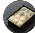
和菓子司ほんぽんや 「くるみ餅」