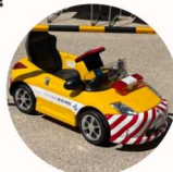
ミニパト試乗 (お子さま用)

阪神高速と高速道路交通警察隊による交通安全に関する情報発信のほか、阪神高速パトロールカーを模したお子さま向けの「ミニパト」や「パトロール隊員の制服」、「免許証を模した顔はめパネル」をご用意しています。パトロール隊員になりきったお子さまの写真撮影などをお楽しみください！