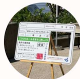
免許証の顔はめパネル