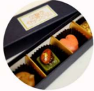
太陽のキャラメル 「生キャラメル」