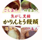
御和菓子司 壽屋 「かりんとう饅頭」