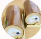
スイーツハウスミュー 「てんにょんのはごろもろろ」