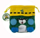
阪神高速サービス 「オリジナルグッズ」