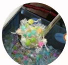
大阪糖菓 コンペイトウプチミュージアム堺 「金平糖すくい取り」