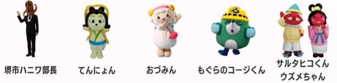
堺市ハニワ部長 てんにょん おづみん もぐらのコージくん サルタヒコくん ウズメちゃん

各自治体や阪神高速・NEXCO西日本のゆるキャラさんがイベント会場に遊びに来るよ！一緒に記念撮影をして思い出を残してみませんか。