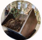
田村商店 TEPPEN 「鉄の素材・端材・廃材 インテリア雑貨」