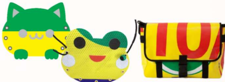
使用済み横断幕を活用した オリジナルポーチ例