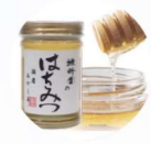
はちみつ屋 雅蜂園 「国産はちみつ、飴、カレーなど」