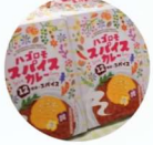
羽衣国際大学 食物栄養学科 「ハコロモスパイスカレー」