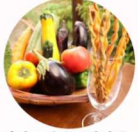
あおいりのおかし 「VEGESTICK」 (プレッツェル)