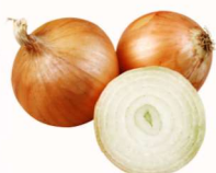
泉州の獲れたて野菜

※当日の仕入状況によっては、野菜の種類や産地の変更やその他来場者プレゼントに変更となる場合がございます。予めご了承ください。