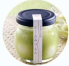
泉州庵 「くーのみもち」

各自治体の特産品や魅力ある地元のお店をはじめ、焼き立てパンやドーナツ、アップサイクル製品および阪神高速オリジナルグッズなどが集結！当日は、ほかに各ブースでたくさんの魅力ある商品をラインナップ・販売する予定ですので、お楽しみに！