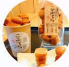
くろがね鐵 「こふてら」