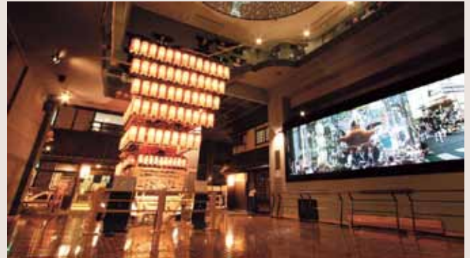
④岸和田だんじり会館