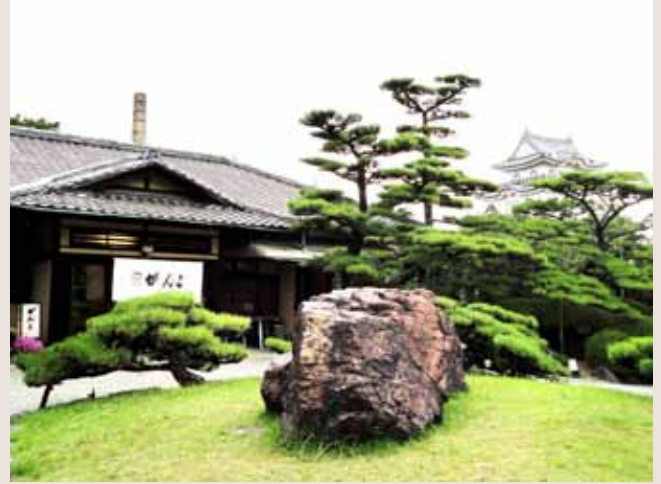
②がんこ岸和田五風荘