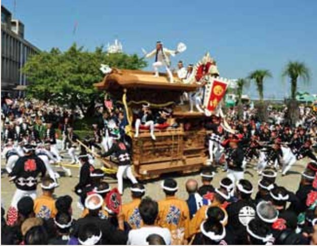
①岸和田だんじり祭 岸和田だんじり祭は約300年の歴史と伝統を誇り、3日間で約60万人が訪れる。

泉州では、9月から10月にかけて、地元にも伝わる伝統の祭として、「だんじり」、「ふとん太鼓」、「やぐら」が勇壮華麗にまちを練り歩き、泉州の秋を彩ります。なかでも、「岸和田だんじり祭」は、日本でも有数の勇壮で壮大な祭として有名で、内外から多くの観光客が訪れます。